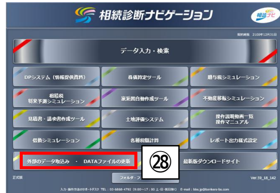
相続診断ナビゲーション 初期画面